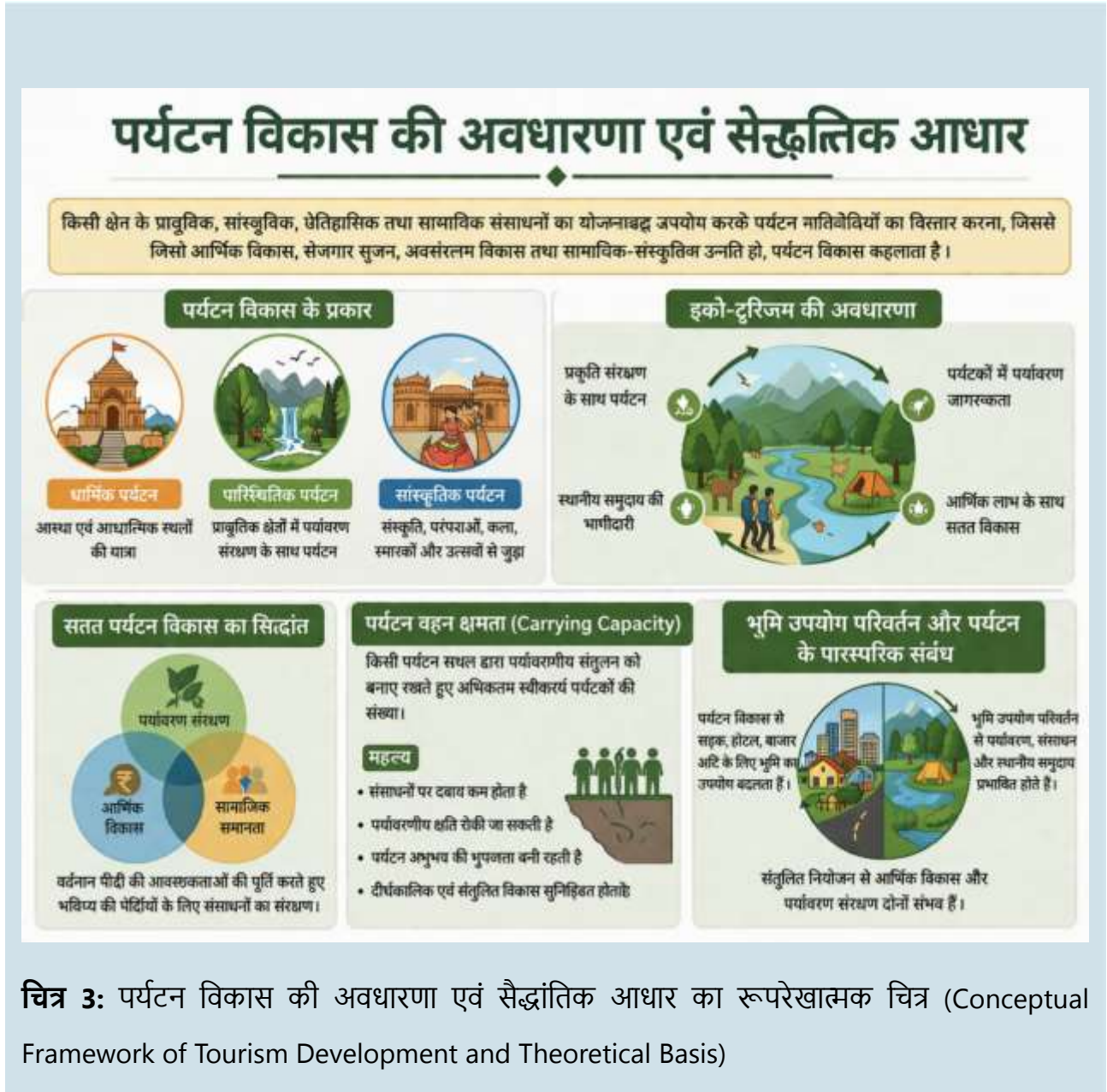
चित्र 3: पर्यटन विकास की अवधारणा एवं सैद्धांतिक आधार का रूपरेखात्मक चित्र (Conceptual Framework of Tourism Development and Theoretical Basis)

और प्रचार-प्रसार में महत्वपूर्ण भूमिका निभाता है। इस प्रकार पर्यटन के विभिन्न प्रकार किसी क्षेत्र के बहुआयामी विकास में सहायक होते हैं।